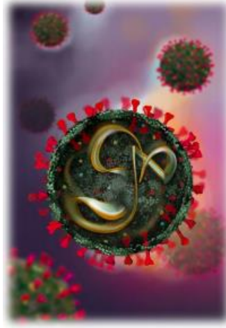
Şekil : SARS CoV-2, virüsün temsili kesiti (Çizim: Merve Evren, Ege Üniversitesi)

Koronavirüsler, tek zincirli, zarflı RNA virüsleridir. Yüzeylerinde çubuksu uzantıları vardır. Virüsün yüzeyindeki uzantıların taça benzetilmesi nedeniyle Latince'de taç anlamına gelen "corona"dan yola çıkılarak Coronavirus (taçlı virüs) ismi verilmiştir. Zarflı virüsler olduğu için dış ortama ve dezenfektanlara duyarlıdır; fakat dış ortamda, özellikle cansız objelerin üzerinde bir süre canlı kalabilmektedir.