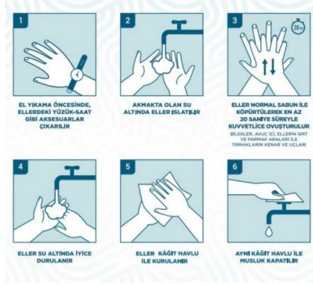
Şekil: Uygun el yıkama tekniği (Kaynak: Sağlık Bakanlığı)